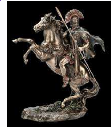
Alexander der Große

Geflügeltes Pferd der Griechen — Freiheit und Transzendenz