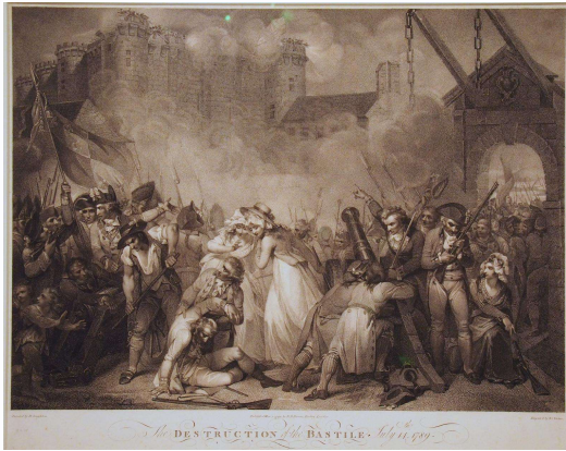
Sturm auf die Bastille