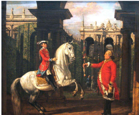
Spanische Hofreitschule Wien