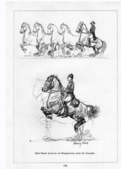
Lipizzaner in der Levade