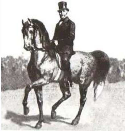
Gustav Steinbrecht (1808–1885)