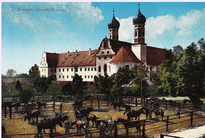
Remonte-Depot Benediktbeuern (um 1900)

Schon damals wusste man das. Zugleich war es austauschbar — Funktion in einem System.